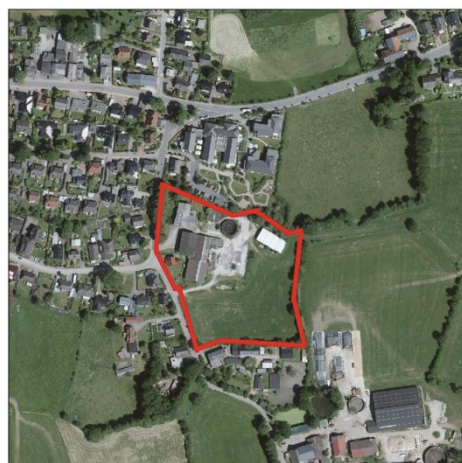
Bestand (Luftbild, Digitaler Atlas Nord 2022)